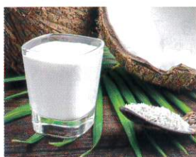
※写真は調理例です。