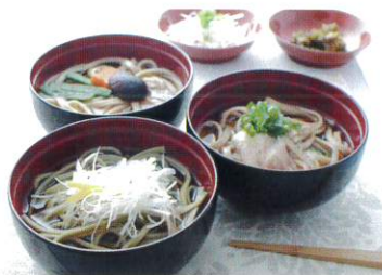
※写真は調理例です。

群馬県館林市の老舗花山うどんの熟練技による乾麺。国産有機小麦(北海道・今城農園)とミネラル豊富な赤穂の塩を使いました。つるつるした一級小麦の味わいが美味しい大吟醸、ミネラルや食物繊維をたっぷりの全粒粉玄小麦、有機小松菜を練りこんだヘルシーなうどんたち。